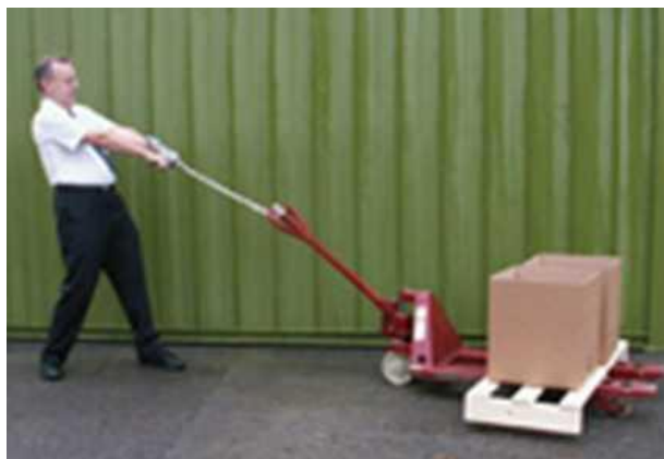
Imágenes 1 y 2. Dinamómetro y utilización del dinamómetro